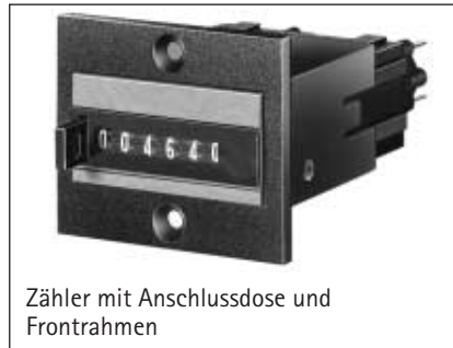
Zähler mit Anschlussdose und Frontrahmen