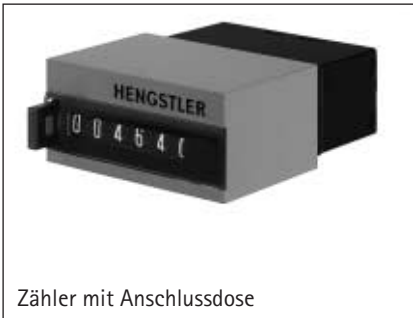
Zähler mit Anschlussdose